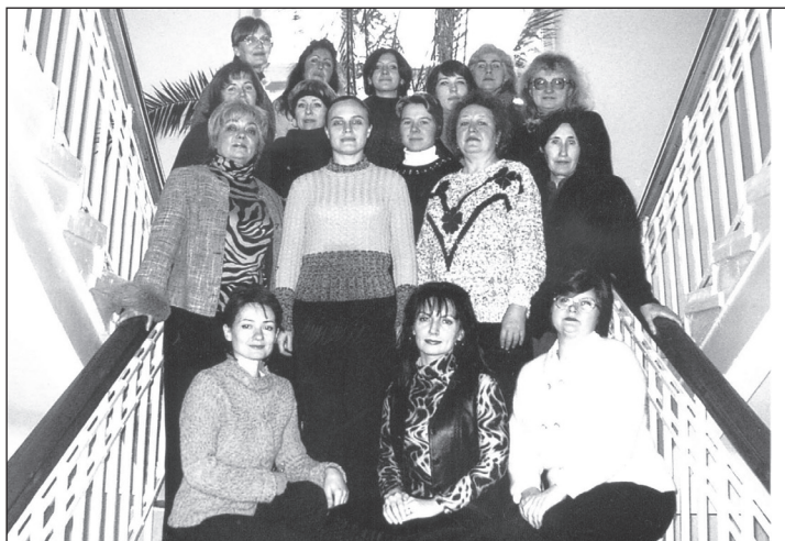
Кафедра музики, 2005 рік