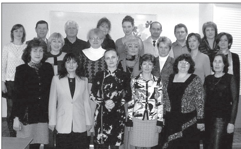
Кафедра музики, 2008 рік

навчально-методичні комплекси навчальних дисциплін, підготовлено пакет документів для акредитації спеціальності 6.02020401, 7.02020401 «Музичне мистецтво» за двома освітньо-кваліфікаційними рівнями – бакалавра і спеціаліста (2008–2009 н. р.). Це дало змогу вивершити статус професійної підготовки студентів-музикантів на рівень спеціальної музичної освіти та значно розширити їхню сферу майбутньої діяльності, включаючи не лише середні загальноосвітні навчальні заклади, але й початкові спеціалізовані школи естетичного виховання (дитячі музичні школи, школи мистецтва тощо). Акредитація вможливила поєднання музики з іншими спеціальностями: початкове навчання – музика (1981–2012), дошкільне виховання – музика (2004–2009), культурологія – музика (2002–2010), музика – практична психологія (2007–2012), музика – соціальна педагогіка (2000–2016), музика – режисура шкільних музично-виховних заходів (з 2012).