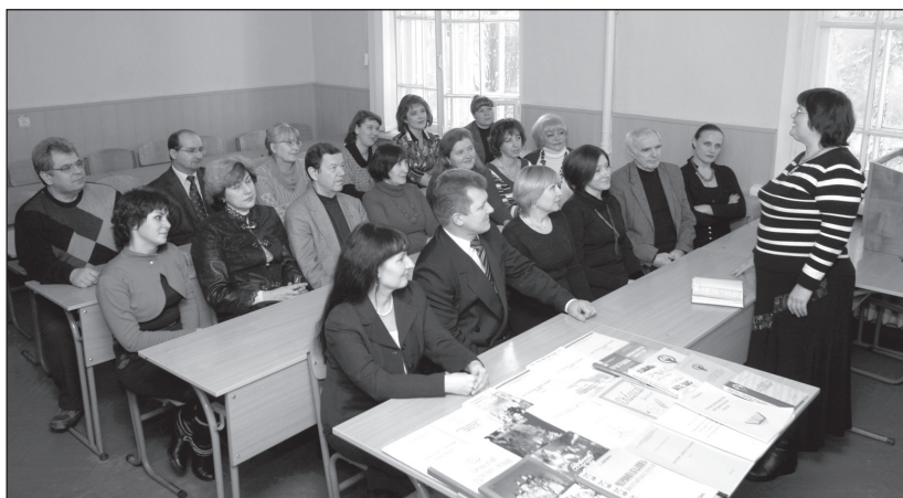
Методичний семінар кафедри музики, 2012 рік