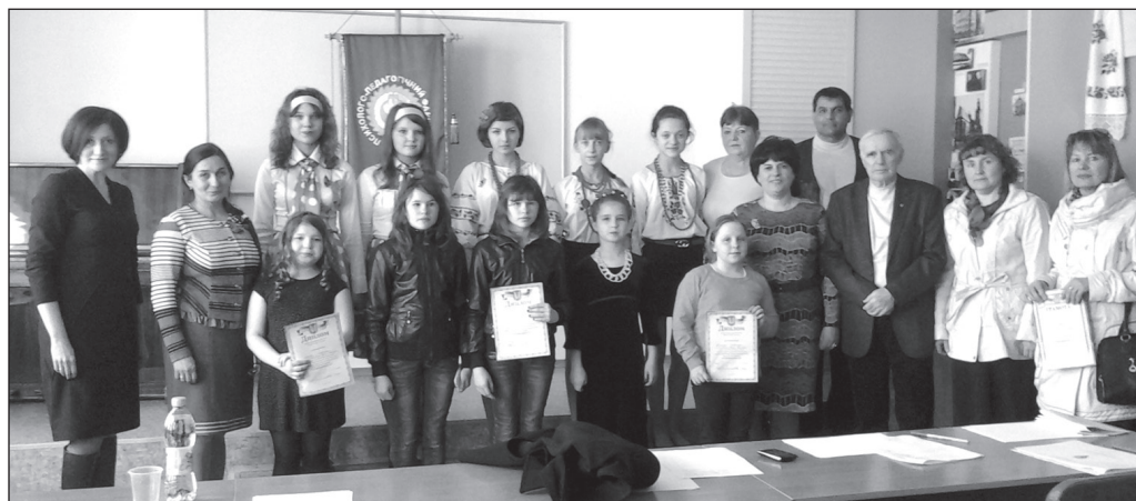
Обласний конкурс кафедри музики «Музичний вернісаж – 2015»

Більш детальна інформація про історію кафедри міститься в колективній монографії «Кафедра музики Полтавського національного педагогічного університету імені В. Г. Короленка: ретроспективний аналіз» за адресою: http://ped.pnpu.edu.ua/music.php .